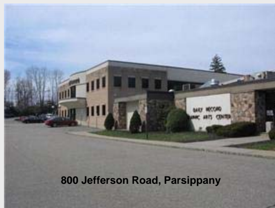
800 Jefferson Road, Parsippany